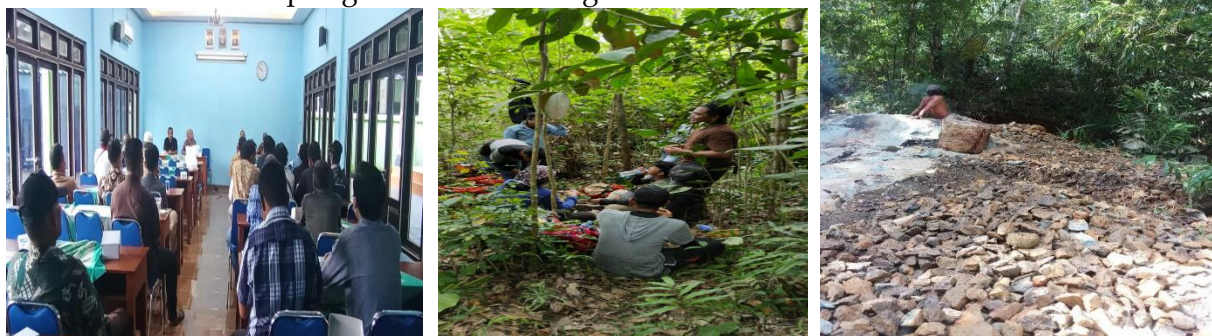
Gambar 2. Dokumentasi Kegiatan Pelatihan dan Pengambilan Data Lapangan

Dokumentasi terhadap kegiatan adalah sebagai berikut: