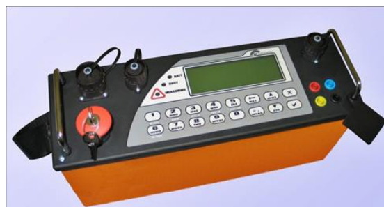
Gambar 1. Alat Geolistrik