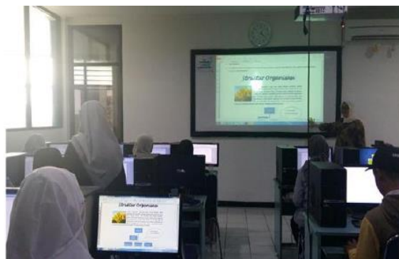
Gambar 2. Pelaksanaan kegiatan pelatihan.

Hasil dari kegiatan PKM pada PKBM Negeri 11 Manggarai adalah sebagai berikut: a. Terdapat 16 peserta yang mengikuti pelatihan penggunaan Microsoft Word untuk siswa PKBM. b. Dengan pelatihan ini peserta dapat memahami penggunaan Microsoft Word untuk kegiatan pembelajaran dan mampu mempraktekkan Microsoft Word yang disampaikan oleh Instruktur. c. Peserta mampu mempraktekkan materi yang disampaikan untuk keperluan mengerjakan tugas dalam kegiatan pembelajaran dan mengerjakan kegiatan lain diluar kegiatan sekolah, misalnya mengetik surat untuk melamar pekerjaan ,membuat proposal suatu kegiatan di lingkungan masyarakat. Berikut ini foto kegiatan pelaksanaan pelatihan :