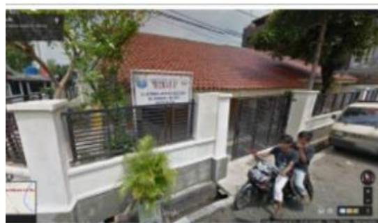
Gambar 1. Gedung PKBM Negeri 11 Manggarai Jakarta Selatan

Untuk itulah diperlukan kerja sama antara PKBM Negeri 11 Manggarai dengan Universitas Budi Luhur Fakultas Teknologi Informasi untuk bersama-sama memberikan peningkatan kemampuan penggunaan aplikasi Microsoft Word bagi siswa siswi PKBM Negeri 11 Jakarta. Kerjasama yang terjalin akan memberikan solusi atas permasalahan yang dihadapi oleh PKBM dengan diselenggarakan pelatihan Microsoft Word bagi siswa PKBM yang dilaksanakan di laboratorium ICT Universitas Budi Luhur. Siswa siswi PKBM yang mengikuti pelatihan adalah siswa kejar paket C atau setara dengan SMA. Berikut ini foto gedung sekolah PKBM Negeri 11 Manggarai Jakarta Selatan tertera pada gambar 1 :