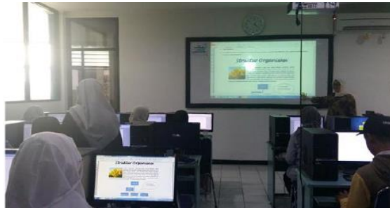
Gambar 3. Pelaksanaan kegiatan pelatihan.

Dari gambar 2 dapat dilihat instruktur sedang menerangkan materi Microsoft word kepada peserta. Adapun kegiatan pelatihan yang sudah dilaksanakan sebagai berikut :