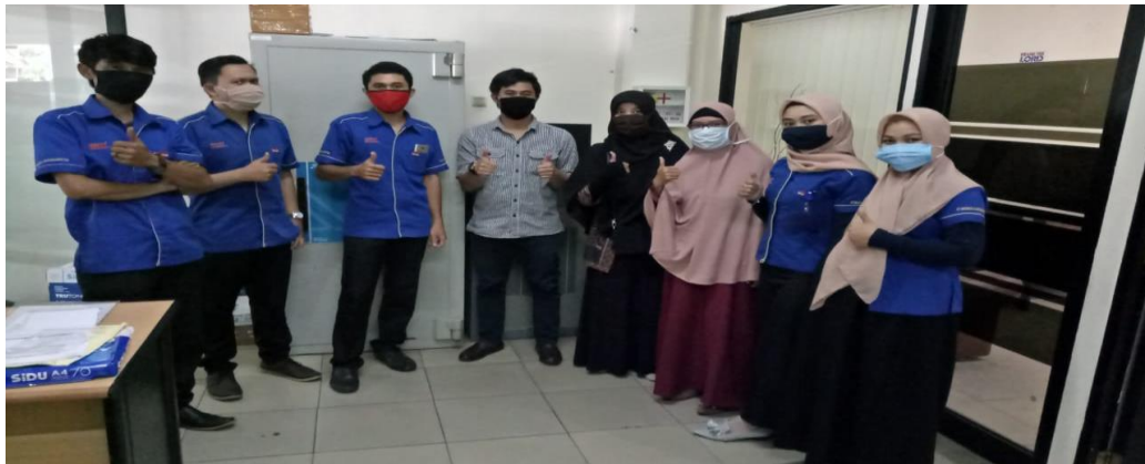
Gambar 4. Peserta Pelatihan tentang Aplikasi ANSIS (Analisa System) Pada Karyawan Credit Analis Dalam Pemberian kredit motor