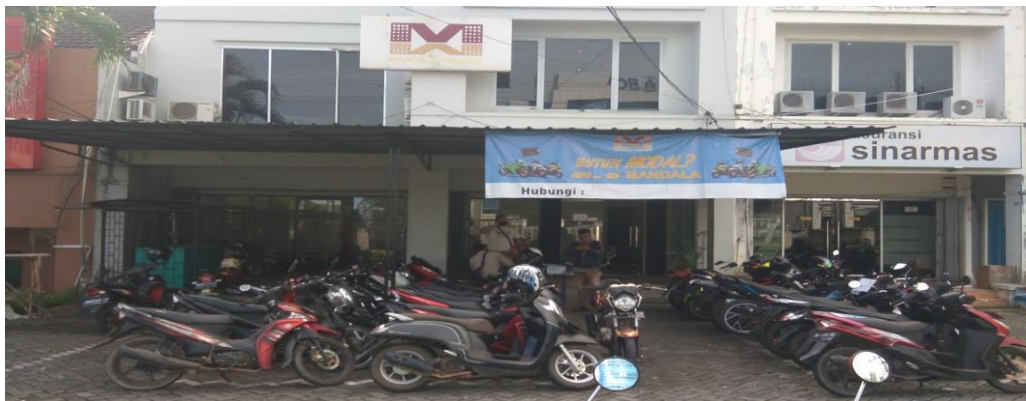
Gambar 2. Gedung Mandala Pangkalpinang