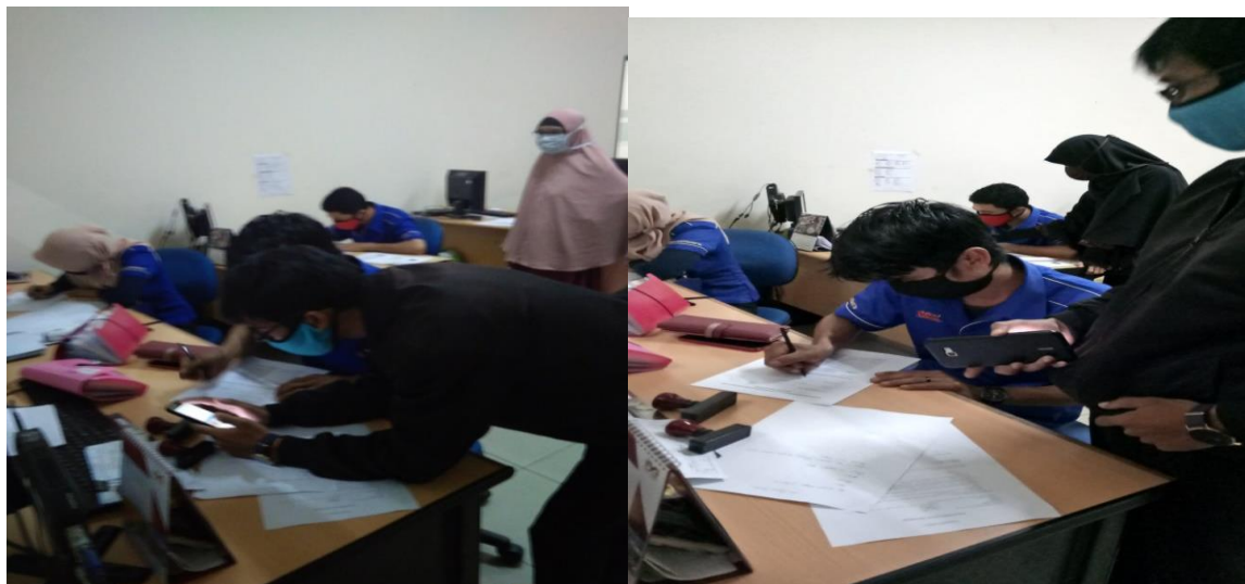
Gambar 3. Peserta Pelatihan tentang Aplikasi ANSIS (Analisa System) Pada Karyawan Credit Analis Dalam Pemberian kredit motor