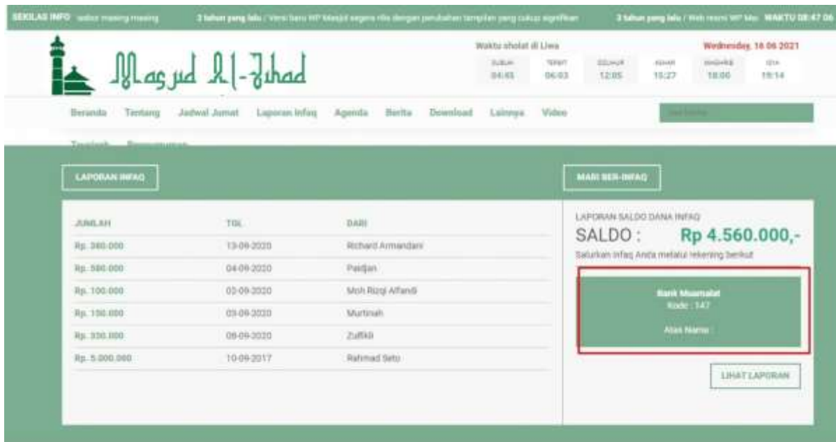
Gambar 2. Web Masjid Al-Jihad