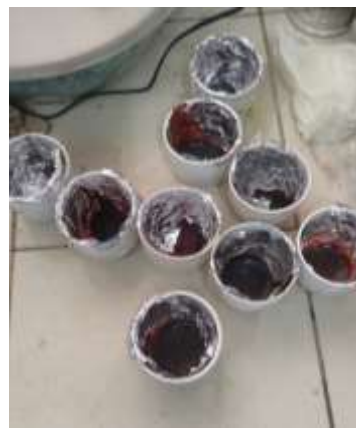
Gambar 3. Tinta Setelah Pengujian

Gambar 2 dan 3 memperlihatkan kondisi tinta sebelum dan setelah dipanaskan di oven drying pada suhu 105°C selama 1 jam. Dari gambar tersebut, dapat dilihat bahwa tinta yang belum dipanaskan memiliki warna yang lebih terang dan tekstur yang lebih cair. Namun, setelah pemanasan, warna tinta menjadi lebih gelap dan teksturnya terlihat lebih kental.