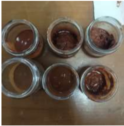
Gambar 2. Tinta sebelum pengujian

Pada penelitian yang mengkaji kandungan pada tinta cetak seperti halnya pelarut, gum arabic dalam tinta organik juga mempengaruhi kandungan padatan dan ketahanan tinta. Peningkatan kandungan pengikat atau pelarut yang digunakan dalam tinta dapat mengubah konsistensi, viskositas, dan ketahanan tinta pada bahan cetak, yang penting dalam menentukan kualitas hasil cetakan dan daya tahan tinta (Mau Dang et al., 2019).