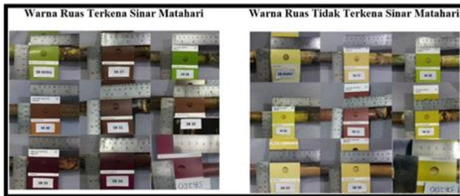
Gambar 2. Warna ruas tanaman tebu

Seluruh karakter morfologi diturunkan oleh genetik tetuanya seperti bentuk ruas batang dan mata tunas. Sesuai dengan Hukum Mendel I atau Hukum Segregasi bahwa tiap sifat dari suatu organisme/individu dikendalikan sepasang faktor keturunan yang disebut dengan gen atau DNA dari tetua jantan dan betina yang akan membentuk alel (bentuk karakter turunan dari kedua tetua), namun jika keturunan mengekspresikan faktor dominan maka akan menutupi faktor resesif. Perubahan genetik tunggal, beberapa gen atau susunan kromosom yang disebut dengan mutasi dapat terjadi akibat faktor lingkungan sehingga akan memunculkan