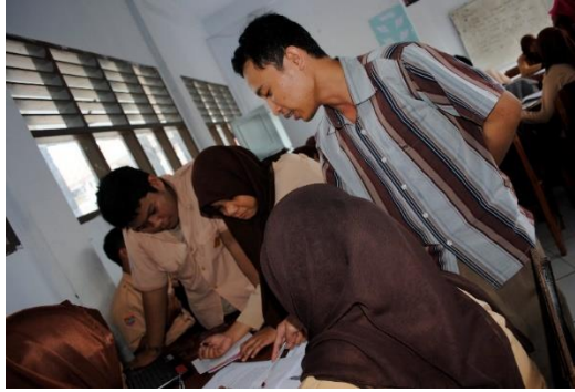
Gambar 3. Peserta didik sedang mengerjakan LKPD

Berdasarkan hasil analisis respon peserta didik terhadap lembar kerja peserta didik dengan pendekatan pemecahan masalah diperoleh persentase rata-rata respon peserta didik terhadap perangkat pembelajaran adalah 83,0 %. Persentase ini termasuk dalam kriteria sangat setuju atau termasuk dalam kriteria positif karena berada pada rentang nilai ( 81\% \leq x \leq 100\% ) sesuai dengan tabel 3. kriteria interpretasi skor oleh peserta didik.