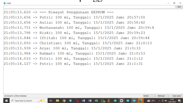
Gambar 3. Data yang disimpan pada Eeprom

jumlah air yang dikeluarkan berhasil disimpan dengan baik. Ini penting untuk pengelolaan data penggunaan air dan untuk analisis lebih lanjut mengenai pola konsumsi air oleh pengguna.