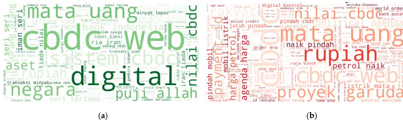
Gambar 6. Hasil Perbandingan Wordcloud Komunitas X terhadap Isu Pembuatan CBDC di Indonesia (a) Visualisasi wordcloud pengalaman yang positif; (b) Visualisasi wordcloud pengalaman yang negatif

Sementara itu, pada kelompok sentimen negatif, diskusi lebih banyak dipenuhi oleh kata-kata seperti “rupiah”, “proyek”, “garuda”, “nilai”, dan “kontrol”. Dominasi istilah tersebut menunjukkan adanya kekhawatiran masyarakat terhadap dampak implementasi CBDC, terutama terkait pengawasan sistem keuangan, stabilitas nilai mata uang, serta kontrol pemerintah terhadap transaksi digital. Perbedaan distribusi kata pada kedua kategori sentimen tersebut memperlihatkan bahwa opini publik mengenai Rupiah Digital masih menimbulkan beragam persepsi di kalangan masyarakat. Visualisasi hasil wordcloud dapat dilihat pada Gambar 6.