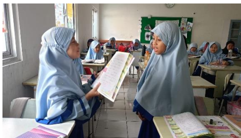
Gambar 2. Siswa Menghafal Mufrodlat

Hasil observasi guru pada Siklus I menunjukkan bahwa pembelajaran telah mengalami perbaikan. Guru mulai memberikan model pengucapan, melaksanakan latihan pengulangan secara terarah, serta memberi kesempatan kepada siswa untuk menirukan dan mempraktikkan dialog sederhana. Guru juga mulai menggunakan media audio, meskipun variasinya masih terbatas. Observasi aktivitas peserta didik menunjukkan adanya peningkatan keterlibatan siswa. Siswa mulai aktif menirukan pengucapan, berpartisipasi dalam latihan drilling, serta berani menjawab pertanyaan guru secara lisan. Kegiatan dialog berpasangan mulai diterapkan, meskipun masih terdapat beberapa siswa yang belum sepenuhnya percaya diri.