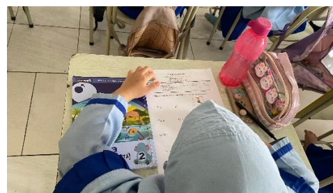
Gambar 3. Tes Hasil Belajar Siklus I

Hasil wawancara dengan guru menunjukkan bahwa metode audiolingual memberikan dampak positif terhadap aktivitas dan keberanian siswa dalam berbicara, namun masih diperlukan variasi latihan dan pengelolaan waktu yang lebih baik. Sementara itu, hasil wawancara dengan peserta didik menunjukkan bahwa siswa merasa terbantu dengan latihan menirukan dan mengulang pengucapan, serta mulai merasa lebih mudah dalam mengucapkan kosakata bahasa Arab.