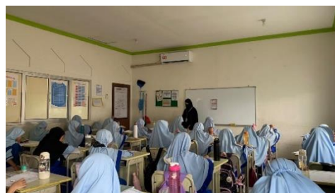
Gambar 5. Proses pembelajaran siklus II

Berdasarkan data hasil belajar, observasi, dan wawancara pada setiap siklus, terlihat adanya peningkatan ketuntasan belajar siswa secara bertahap dari pra siklus hingga Siklus II. Jumlah siswa yang belum mencapai ketuntasan menurun secara signifikan, dari 7 siswa pada pra siklus, menjadi 1 siswa pada Siklus I, dan akhirnya 0 siswa pada Siklus II. Temuan ini menunjukkan bahwa metode audiolingual efektif digunakan untuk meningkatkan hasil belajar bahasa Arab pada siswa kelas rendah, khususnya dalam mengembangkan keterampilan menyimak dan berbicara melalui pembiasaan, peniruan, dan latihan lisan yang terstruktur.