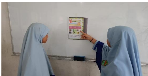
Gambar 4. Interaksi Siswa Dalam Pembelajaran

Observasi aktivitas peserta didik menunjukkan peningkatan yang sangat signifikan. Hampir seluruh siswa aktif menirukan pengucapan, berpartisipasi dalam latihan pengulangan, serta berani berbicara menggunakan kosakata dan kalimat sederhana dalam dialog berpasangan. Antusiasme dan fokus siswa selama pembelajaran juga meningkat secara nyata. Hasil wawancara dengan guru menunjukkan bahwa metode audiolingual memberikan dampak positif yang kuat terhadap pengucapan, kepercayaan diri, dan hasil belajar siswa. Sementara itu, hasil wawancara dengan peserta didik menunjukkan bahwa siswa merasa pembelajaran bahasa Arab menjadi lebih mudah, menyenangkan, dan ingin kembali melakukan latihan dialog pada pertemuan berikutnya.